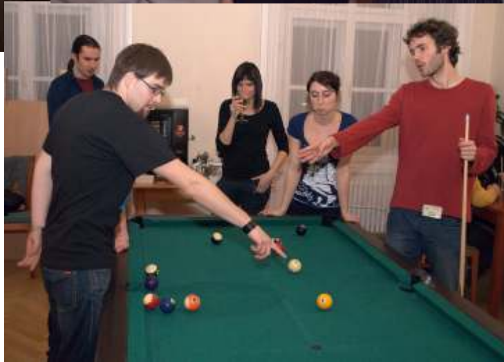
Ve er na XI.Discussions

Krystalografická společnost se podílela i na přípravě tradičních Discussions in Structural Molecular Biology , pořádaných v Nových Hradech, nyní také jako výroní konference české společnosti pro strukturní biologii.