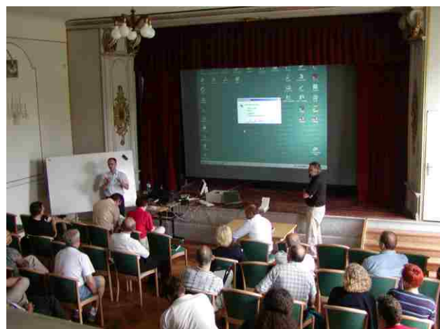
Přednáškový sál - divadlo.

Součástí kolokvia byly i malé workshopy v dobře vybavené počítačové učebně.