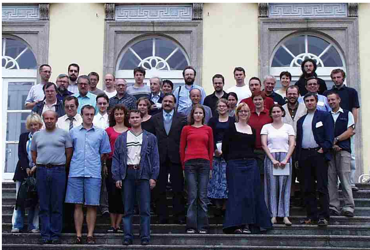
Část účastníků kolokvia.